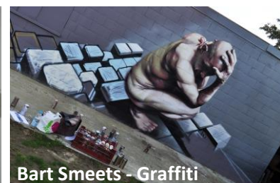
Bart Smeets - Graffiti

'Kunst in de Troost' is open op zaterdag 25 en zondag 26 april (10u-18u) en op maandag 27 april 2015 (11u-18u). De toegang is gratis. De opbrengst van de verkoop gaat naar de restauratie van de basiliek Onze-Lieve-Vrouw-van-Troost.